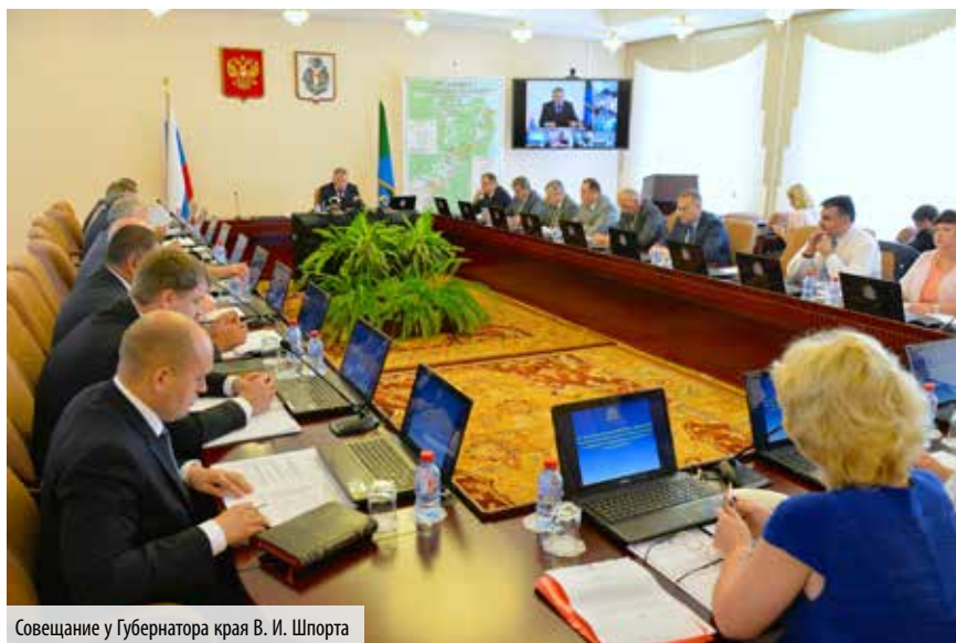
Советание у Губернатора края В. И. Шпорта

Серьезный комплекс мер применяется для стимулирования и поддержки рождаемости, в том числе для увеличения количества многодетных семей, ➔