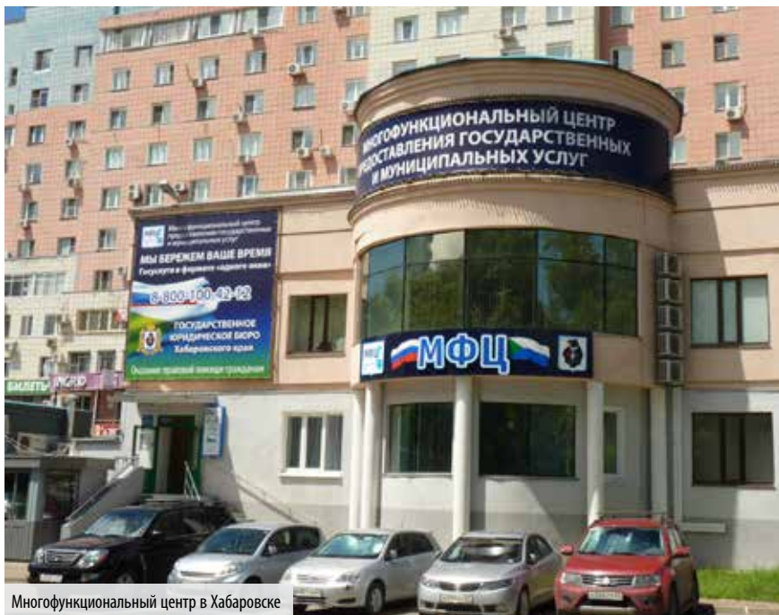
Многофункциональный центр в Хабаровске

С 2014 года работа правительства края впервые будет оцениваться по ключевым показателям эффективности. Всем органам исполнительной власти установлены значения целевых показателей, определены важнейшие мероприятия, которые они обязаны провести в течение года. В случае если они не будут выполнены в срок и в установленных объемах, то это окажет прямое влияние на премиальные выплаты руководителям. При явных провалах последуют более жесткие меры воздействия. Такая методика поможет крепче увязать ответственность руководителей с реализацией госпрограмм и достижением их индикаторов.